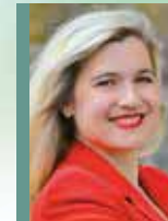
Melanie Huml Bayerische Staatsministerin für Gesundheit und Pflege